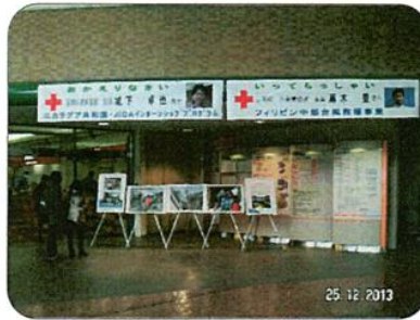
海外支援活動報告の展示パネル