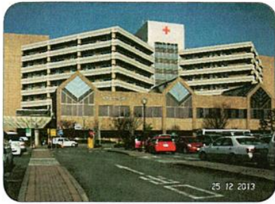
熊本赤十字病院全景