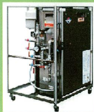
4 室のシャワー迄使用できる灯油ボイラー

身体の不自由なお年寄りや身障者の方が 介護者お一人の介助で入浴する事が出来ます。 組立式ながらも広い室内とメダル管理機能の 自動運転で、災害時等であれば 24 時間稼働 する事も出来ます。